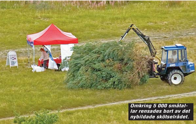
Omkring 5 000 småtallar rensades bort av det nybildade skötselrådet.